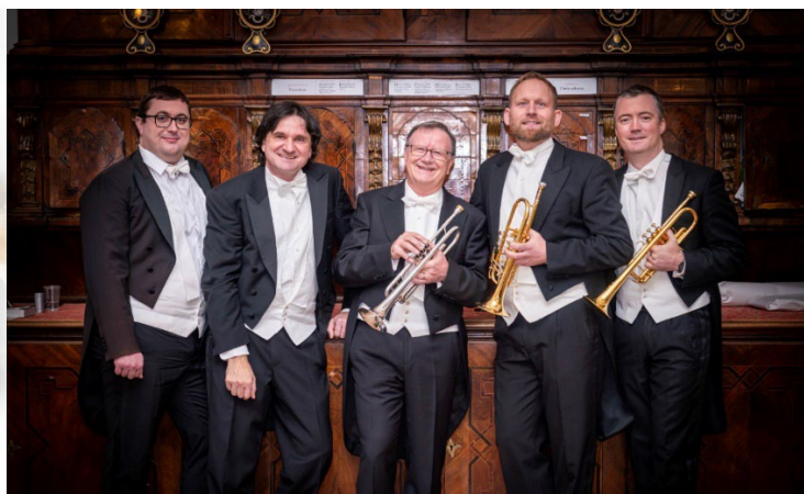
Trumpets in Concert